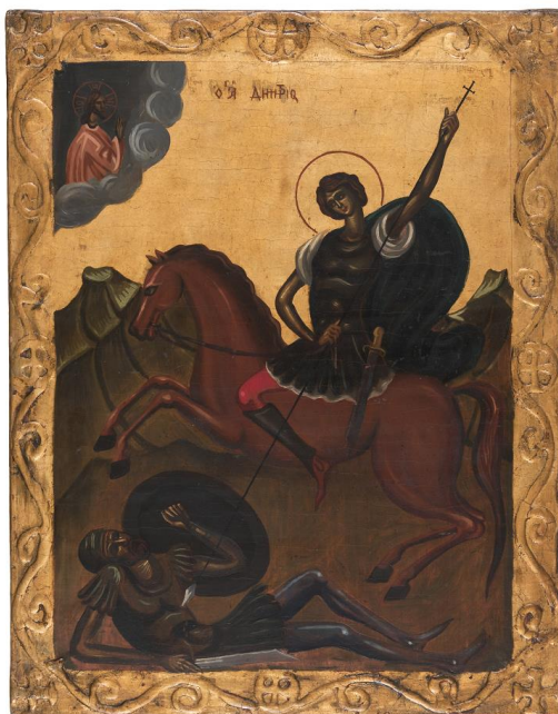
Πολύκλειτος Ρέγκος, Άγιος Δημήτριος, 1935, αυγοτέμπερα σε ξύλο, Μουσείο Βυζαντινού Πολιτισμού, Θεσσαλονίκη, δωρεά Καλλίστης Δαρβέρη (NET 014)