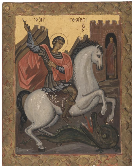
Πολύκλειτος Ρέγκος, Ἅγιος Γεώργιος, 1948(;), αυγοτέμπερα σε ξύλο, Συλλογή Κωνσταντίνου Πολ. Ρέγκου