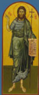
Πρόδρομος, Τέμπρα, 1975