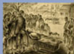
Αθήνα. Σχέδιο, 1941

Η βυζαντινή τέχνη επηρέασε τον Ζαχαρίου και στις πρωτότυπες καλλιτεχνικές δημιουργίες του. Πολλά από τα έργα αυτά, που θα τα βρεις και στην έκθεση, απεικονίζουν το φυσικό και αρχιτεκτονικό περιβάλλον μοναστηριών του Αγίου Όρους. Όπως μπορείς να παρατηρήσεις, άλλα έργα είναι φτιαγμένα με ψηφίδες, άλλα με την τεχνική της αυγοτέμπερας, δηλαδή χρώματα ανακατεμένα με αυγό και άλλα με την τεχνική της εγκαυστικής, δηλαδή χρώματα διαλυμένα σε κεριά και μαστίχα. Δεν είναι τυχαίο ότι αυτές τις τεχνικές χρησιμοποιούσαν οι βυζαντινοί τεχνίτες.