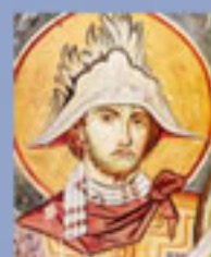
Ο άγιος Μερκούριος. Αντίγραφο τοιχογραφίας από το Πρωτάτο Αγίου Όρους, 1956