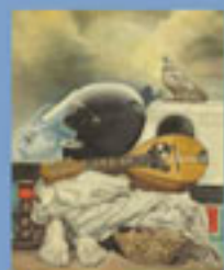
Μοτοσυκλετιστής, Λάδι, 1984

..... Σε αυτήν την ομάδα έργων ο Γκλίνος αποτυπώνει τους προβληματισμούς του για τον κόσμο που μας περιβάλλει.