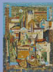
Μονή Δοχειαρίου. Ψηφιδωτό, 1980-88