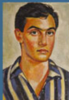
Ο ζωγράφος Καβαλιεράτος, Λάδι

..... Στη διπλανή αίθουσα μπορείς να δεις πίνακες του Γκλίνου που είναι επηρεασμένοι από τη βυζαντινή εικονογραφία. Στην ίδια αίθουσα προσπάθησε να εντοπίσεις και την εικόνα της αγίας Αικατερίνης. Στο έργο αυτό ο ζωγράφος δεν ακολουθεί τα βυζαντινά πρότυπα αλλά τα στοιχεία της δυτικότερης θρησκευτικής ζωγραφικής του 19ου αιώνα.